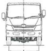
หน่วย : มม.